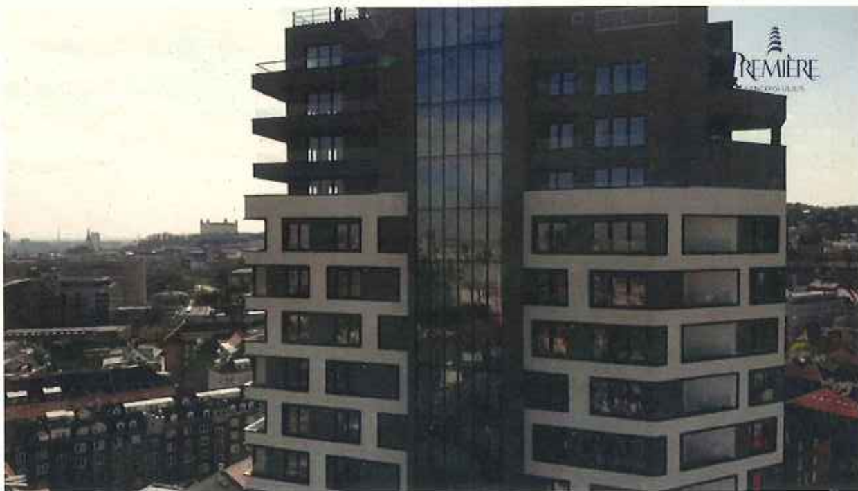
Polyfunkčný objekt Pemiére, Bratislava