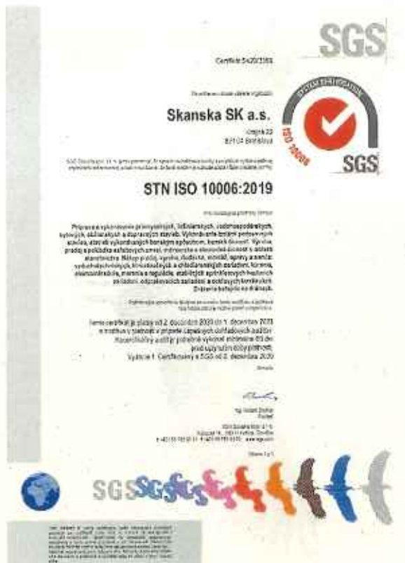
Obrázok č. 3 – Systém manažérstva projektovania