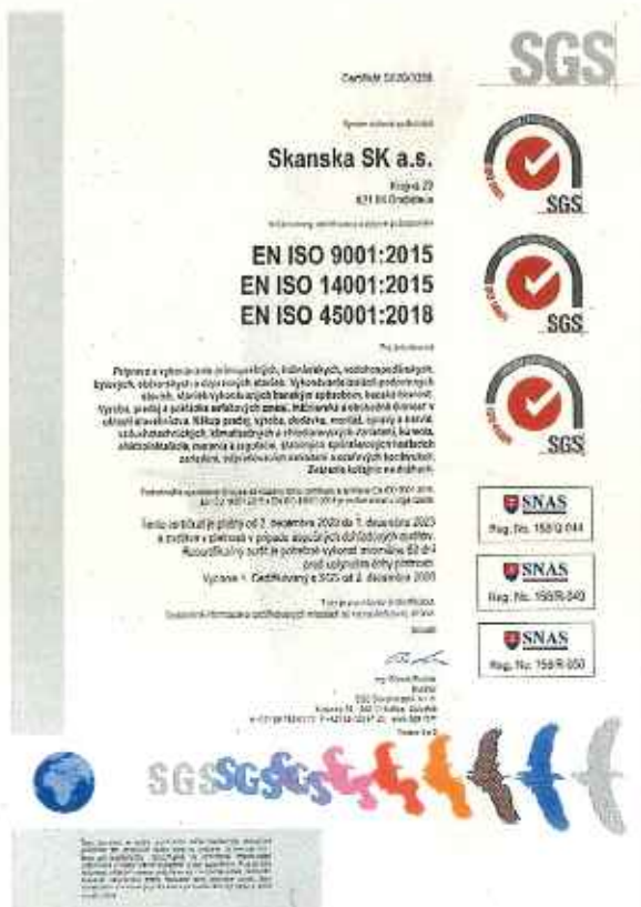
Obrázok č. 1 – Certifikát systému riadenia spoločnosti podľa noriem EN ISO 9001, 14001 a 45001- str. 1 z 2