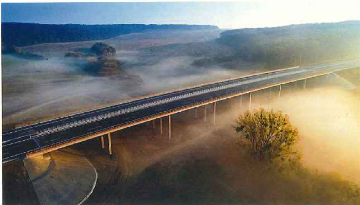
Diaľnica D1 Budimír - Bidovce