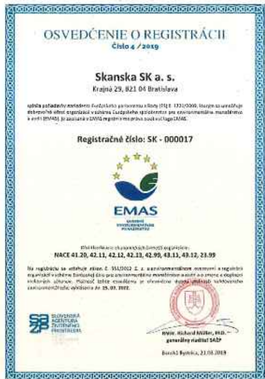
Obrázok č. 4 – Osvedčenie o registrácii v EMAS