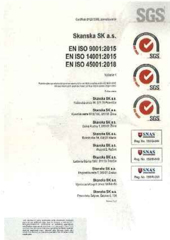
Obrázok č. 2 – Certifikát systému riadenia spoločnosti podľa noriem EN ISO 9001, 14001 a 45001 - str. 2 z 2