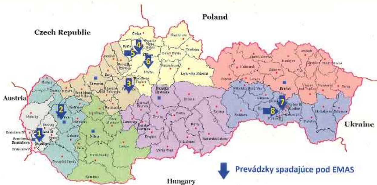
Mapa s prevádzkami zaradenými do schémy EMAS