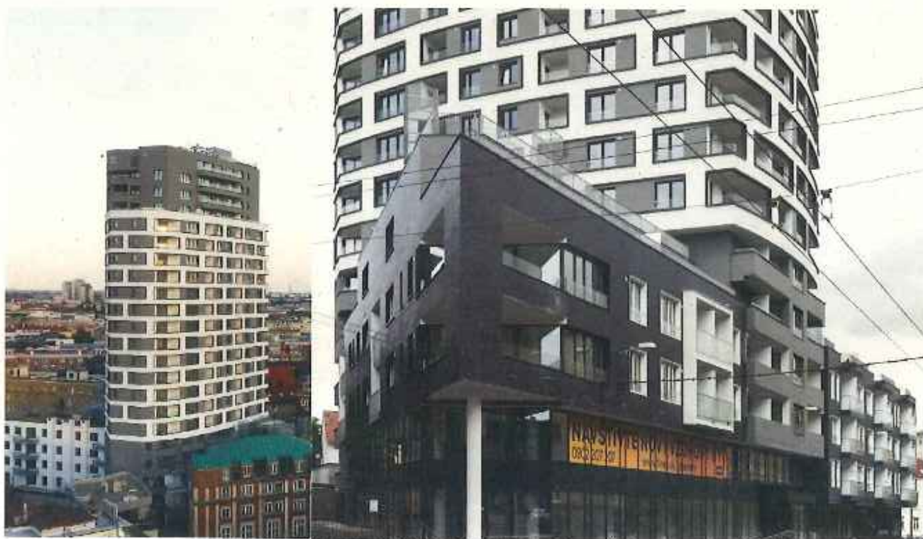
Polyfunkčný objekt PREMIÈRE, Bratislava, Šancová ul.