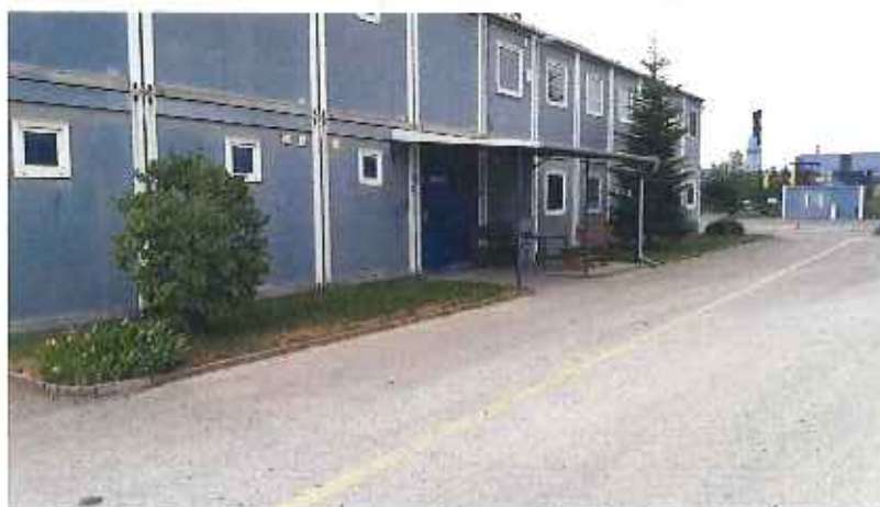
Trávnaté plochy pri prevádzkovom objekte Obal'ovne Veľká Ida