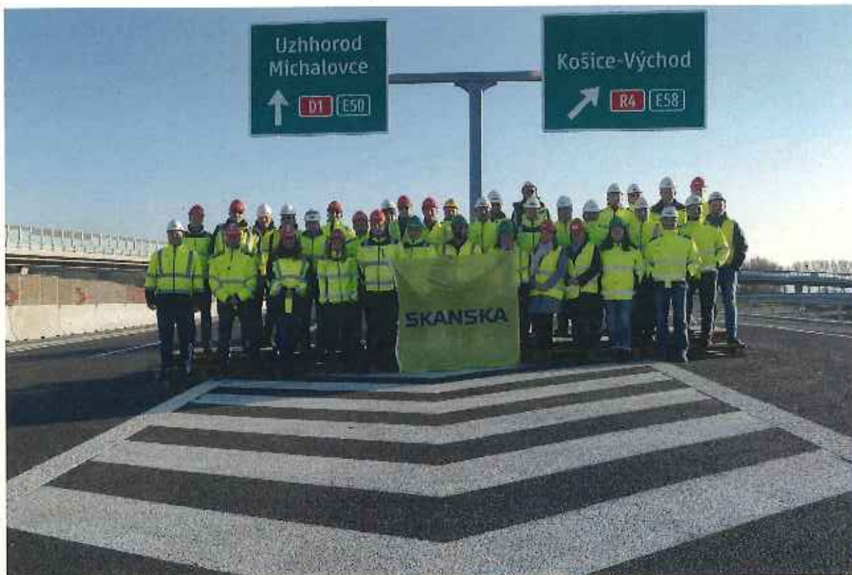
Diaľnica D1 Budimir - Bidovce