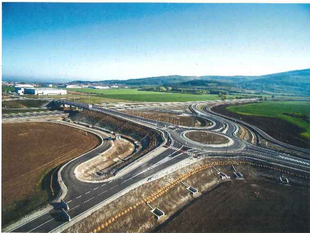
PZ Nitra Mlyndrce - napojenie na R1 - 2. a 4.etapa